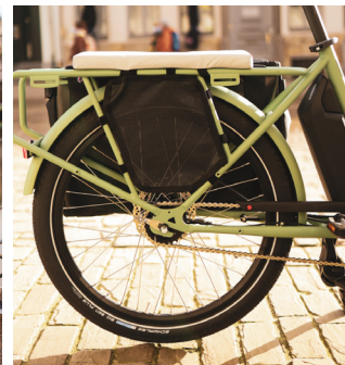
Feet safety covers