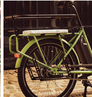
Rear child basket + Hoodie Soft pad